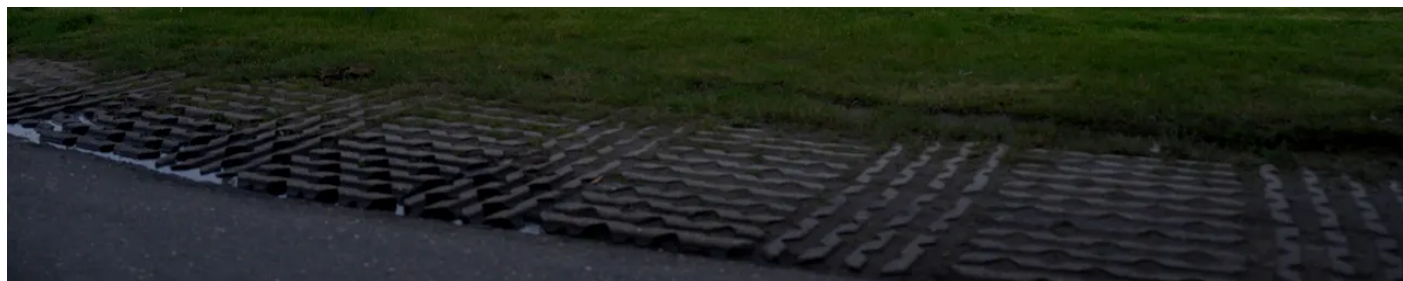
Het datacenter van techreus Microsoft in Middenmeer.

Om toch 'rijksbreed' nog wat gedaan te krijgen bij de grote techbedrijven, is er sinds 2014 een apart gremium, het 'Strategisch Leveranciersmanagement'. Daarin praat de overheid, buiten de aanbestedingen om, met de grootste leveranciers - vooral Microsoft, Amazon en Google - over hun gebruikersvoorwaarden. Soms leidt dat tot een aanpassing. Het is tegelijk een erkenning van de unieke, machtige positie van die bedrijven, én een poging gezamenlijk tegen ze op te trekken.