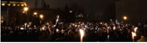
13 december 2025: Péter Magyar tijdens een door zijn partij Tisza georganiseerde protestmars voor kindbescherming in Boedapest.

En dat gebruikt Magyar tegen hem. Hij koppelt de corruptie aan de alledaagse ervaringen van mensen. Van ondergefinancierde scholen tot instortende ziekenhuizen, slecht functionerende treinen en lage lonen: Magyar legt de schuld bij Orbán's regering.