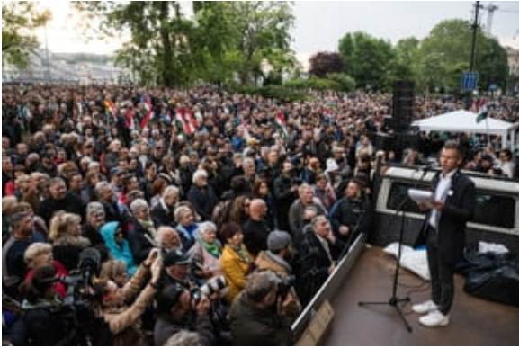
26 april 2024: Péter Magyar spreekt – wederom vanuit zijn wagen met laadbak – een menigte toe tijdens een demonstratie voor het gebouw van het ministerie van Binnenlandse Zaken.

economische elite zichzelf verrijkt, terwijl de democratie wordt uitgehold.