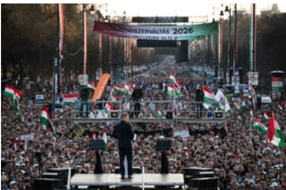
15 maart 2026: Péter Magyar spreekt een menigte in Boedapest toe tijdens de door zijn partij georganiseerde 'Nationale Mars voor systeemverandering'.

En toch willen veel Hongaren deze gok nemen. Het is politiek van het minste kwaad: niemand weet hoe Magyar het zou doen. Wat ze wél weten: als Orbán opnieuw wint, wordt het land alleen maar autocratischer.