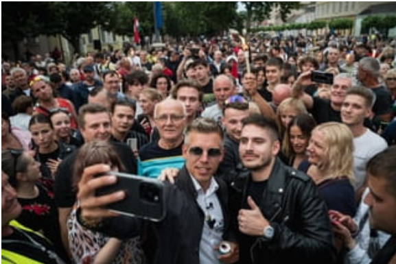
3 juni 2024: Péter Magyar maakt een selfie in Esztergom tijdens zijn nationale tour.

Tompos: 'Deze verkiezingen gaan niet over partijprogramma's of ideologie. Niet over progressief versus conservatief. Ik zie deze verkiezingen als een nationaal referendum over Orbán.'