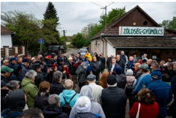
18 april 2024: Péter Magyar gaat in gesprek met inwoners van het district Békés tijdens zijn landelijke tour.